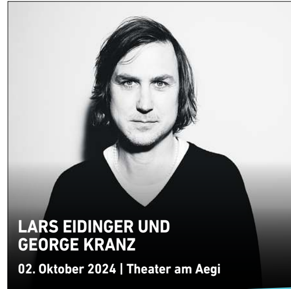
LARS EIDINGER UND GEORGE KRANZ 02. Oktober 2024 | Theater am Aegi

Ihr persönlicher Ticketservice der HAZ & NP