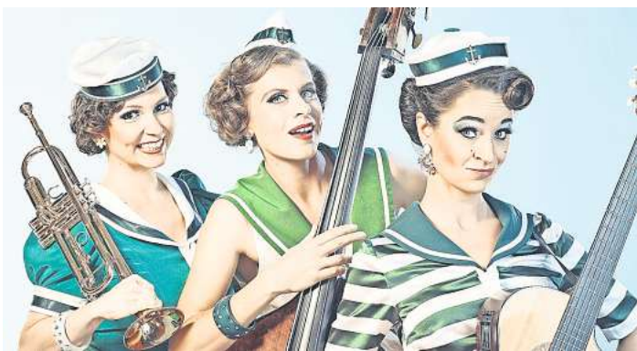
Begeistern dreistimmig singend: die Zucchini Sistaz.

LANGENHAGEN. In der nächsten Woche steht wieder ein buntes Potpourri aus Musik, Kabarett, Comedy und Magie bei der Mimuse auf dem Programm. Martin Sierp philosophiert am Donnerstag, 18. April, ab 20 Uhr im daunstärks mit viel Witz und Selbstironie über sein Leben in seinem Programm „Knackig! Zumindest die Gelenke“ Es gibt an der Abendkasse noch Tickets zum Preis von 19 Euro. Am Sonnabend, 20. April, um 20 Uhr können sich die Besucher auf das Kultformat „Brod“ und Spieler“ im Theatersaal freuen. Matthias Brodowy präsentiert seine illust-