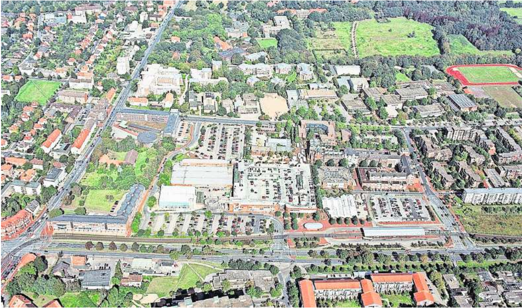
Ideen gesucht: Wie soll das Langenhagener Stadtzentrum sich in den nächsten Jahren entwickeln?, fragt die Verwaltung und startet dazu ein großes Beteiligungsverfahren.

An insgesamt 27 Themenstationen wird die Entwicklung Langenhagens in den vergangenen 65 Jahren in Text und Bild dokumentiert. Dazu gehören ein Rückblick auf die Verleihung des Stadttitels, aber auch auf andere wichtige Ereignisse wie die Gemeindegebietsreform 1974 und die Entwicklung des Stadtzentrums. Auch kreative Protestaktionen wie die Grenzbegehung